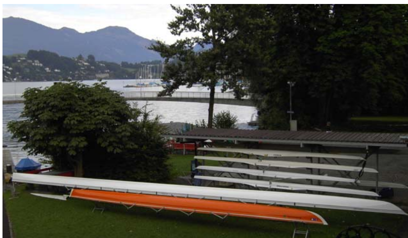
Boote in Luzern

Alle waren nun froh, dass die Boote in Luzern beim Ruderclub Reuss unbeschädigt und gesäubert zurückgegeben werden konnten.