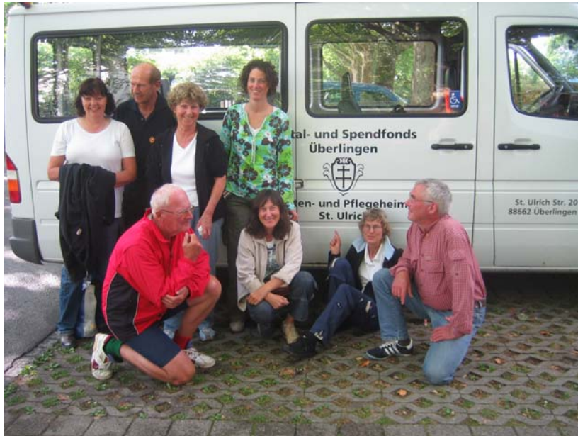
Start zur Heimfahrt, Foto Ulrike Gut

Alle Fahrtteilnehmer und –teilnehmerinnen waren stolz, trotz nicht ganz einfacher Bedingungen, das Tourenziel erreicht zu haben. Die vielen Eindrücke landschaftlicher, kultureller und gemeinschaftlicher Art und die besondere Harmonie bei dieser Tour werden uns allen Motiv für gleichartige zukünftige Unternehmungen sein.