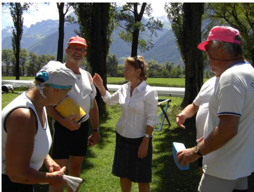
Begrüßung in Flüelen und Vesperpause, Foto Silke Speer

Der Wind im Urner See war diesmal erstaunlich gering für die Uhrzeit zwischen 13 und 14 Uhr, so dass beide Boote ohne Schwierigkeiten das Ziel erreichten, wo wir von den Mitgliedern des Ruderclub Flüelen freundschaftlich begrüßt wurden.