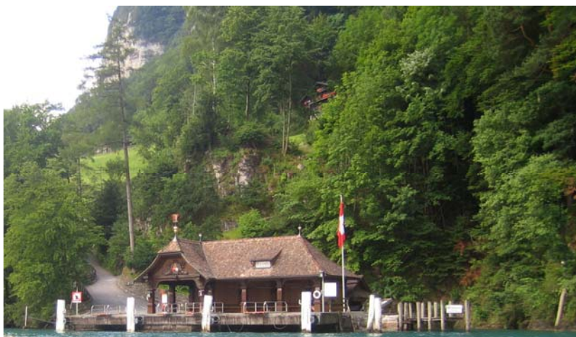
Rütli

Der Schillerstein, auch unter dem Namen Mythenstein bekannt, ist ein knapp 30 Meter hoher, markanter Felsblock, der am Eingang zum Urnersee, dem südlichsten Becken des Vierwaldstättersees, aus dem Wasser ragt. Er liegt gegenüber von Brunnen und ist nur vom Wasser her zugänglich. Bereits 1470/1472 wurde ein Fels als Wegweiser zum nahen Rütli erwähnt. Der natürliche Felssporn hatte ursprünglich eine Höhe von rund 40 Metern. 1838 wurde er um ein Drittel gekürzt, als herab fallende Steine die vorbeifahrenden Dampfschiffe gefährdeten. 1859 beschlossen die Urkantone zu Ehren des 100. Geburtstags von Friedrich Schiller, dem Autor des Dramas "Wilhelm Tell", den obeliskförmigen Stein in ein Schillerdenkmal umzuwandeln.