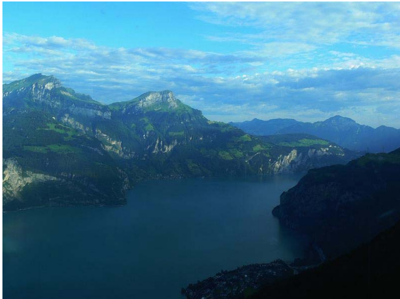
Abfahrt von der Alm

Um 8:30 Uhr wurden unsere beiden Boote von den Flüelener Ruderern verabschiedet und auf den noch spiegelglatten Urner See entlassen.