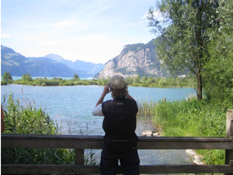
Blick vom Reuss-Delta auf den Uner See

Nach einer Vesperpause, bei der 2 gespendete 5l-Bierfässchen geleert wurden, gab es einen kurzen Rundgang durch das renaturierte Reuss-Delta, dem Zufluss dieses Gebirgsflusses in den Vierwaldstätter See. Danach ging es mit der Seilbahn steil bergauf zur Eggberge Alm, wo wir unser Nachtquartier aufschlugen, zu Abend speisten und dann (alle Männer) bettschwer zum Schlafen gingen, während die Damen noch eine ausführliche Almbegehung machten.