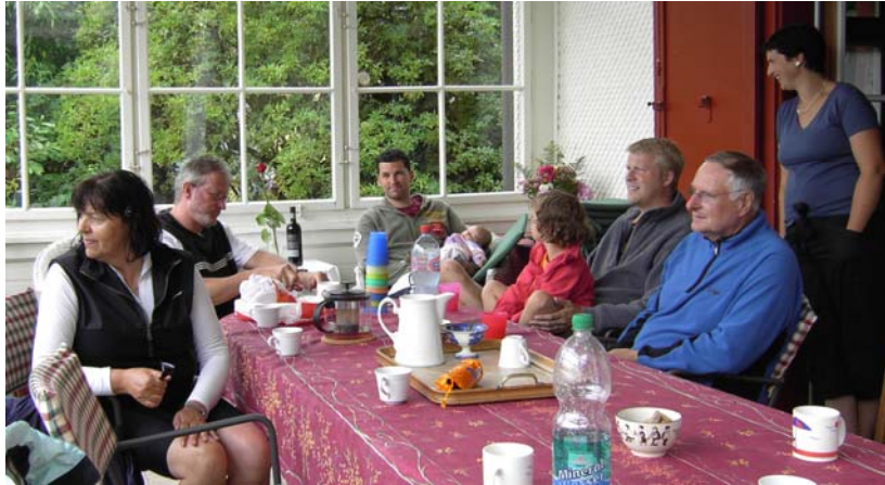
Besatzung gerettet

Der Regen ließ nach, das Blinklicht der Sturmwarnung ging aus, nur einzelne kräftige Windböen ließen Zweifel aufkommen, ob die Weiterfahrt möglich wäre. Der See war immer noch sehr wellig. Eine Gruppe von Ruderern wurde deshalb beauftragt, mit dem Landfahrzeug zu versuchen, in Luzern einen Bootsanhänger zu organisieren, um die angelandeten Boote auf dem Landweg zurücktransportieren zu können.