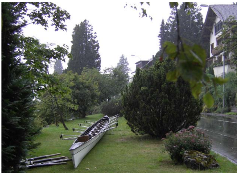
Boot geborgen

Nachdem vom Ufer aus fachkundig geantwortet wurde, dass wir nur auf unser Steuer wegen eines Felsbrockens Acht geben müssten, wurde der Entschluss gefasst anzulanden. Alle Ruderer und Ruderinnen stiegen geordnet gemäß ruhiger Anweisung des Fahrleiters ins Wasser und jeder übernahm eine Aufgabe zur Sicherung des Bootes bzw. des Gepäcks vor Wellenschlag, Steilufer und Felsbrocken im Wasser. Der Achter wurde senkrecht zur Uferlinie ausgerichtet und mit dem Beistand von mittlerweile 2 fachkundig erscheinenden Helfern am Ufer geborgen, ohne dass ein Kratzer an dem langen Boot entstand.