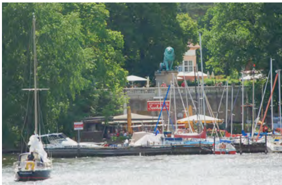
Flensburger Löwe am Wannsee