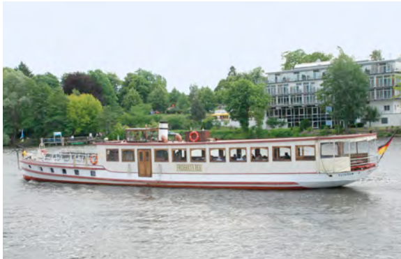
Ausflugsdampfer "Fridericus Rex"